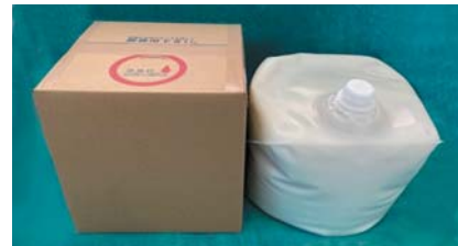
※包装形態／18Lロンテナー