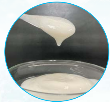
—●— SDT —●— 通常分散 (ホモジナイザー 攪拌羽φ25mm) (10,000rpm×10min 1昼夜静置後)