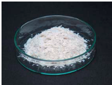
外観：白色フレーク

粘性測定 分散：ホモジナイザー 10,000rpm×10min 測定：25°C、24hr 後 レオメーターにより測定